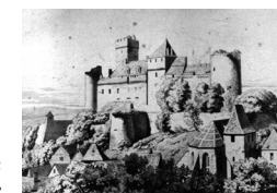
Le château au XIX e siècle

Le château de Castelnau-Bretenoux fut élevé dès le XIII e siècle par les barons de Castelnau de Bretenoux, établis de longue date en Haut-Quercy.