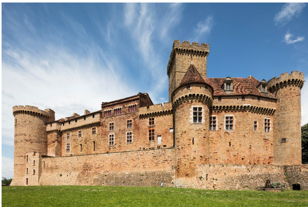
Château de Castelnaud-Bretenoux

À une vingtaine de kilomètres de Rocamadour et de Padirac, le château de Castelnaud-Bretenoux s'élève à l'extrémité d'un éperon rocheux né d'une faille naturelle. Dominant le pays dit « des quatre rivières », la Cère et la Bave, affluents de la Dordogne, ainsi que le Mamoul, il fut le siège d'une importante baronnie issue de l'aristocratie carolingienne quercynoise, les Castelnaud de Bretenoux, déjà possesseurs d'une résidence fortifiée dans les environs au XI e siècle. Le château actuel n'est pas antérieur au XIII e siècle. Au cours des XIV e et XV e siècles, le château adopte sa configuration quasi définitive, avec un ensemble de corps de logis cantonnés de tours, protégés par une enceinte basse et des fossés.