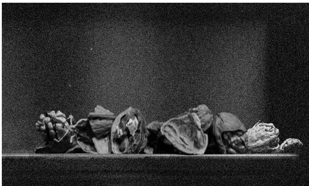
Noix , 2026, 100x50cm, Tirage en cyanotype sur chanvre blanc sur châssis, Origine chanvre: Virgocoop