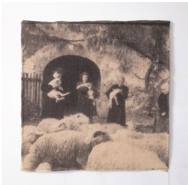
À la Ferme Mirabel , 2026, 101x104cm, Impression UV sur laine caussenarde tricotée contrecollée sur contreplaqué, Origine laine : collectif La Draille. Tricotée par Lulue Pinot Ferraris, Source photo : GAEC Mirabel.